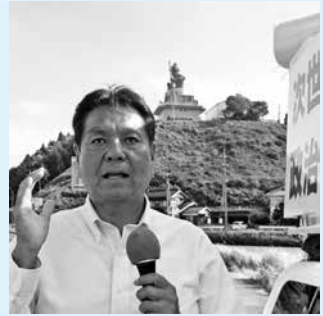
辻立ちを頑張っています！

また、コロナ第一波をうまく乗り越えたといわれる外国(ニュージーランド、ドイツなど)の政治を見ると、情報公開を徹底した、国民に正直な政治でありました。