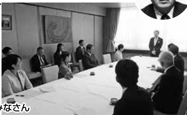
知事に申し入れする会派のみなさん

私も、6月議会の一般質問で、感染症の第1波が一段落した今、想定される第2波、第3波に備え、県庁の各部署において、それぞれの感染症対策が十分であったか、よく点検を行うべきと質問に立ち、知事から、総括するという回答を得ました。