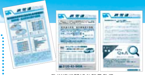
政労連機関紙を毎月発行

政労連傘下では、高齢・障害・求職者雇用支援機構、日本スポーツ振興センター、日本貿易振興機構などがあります。また東・中・西高速道路株式会社、成田国際空港株式会社、社会保険診療報酬支払基金、森林研究・整備機構森林整備センターなどの労組も加盟しており、加盟組織は全国に55単組、組合員は約16,000名で構成されています。